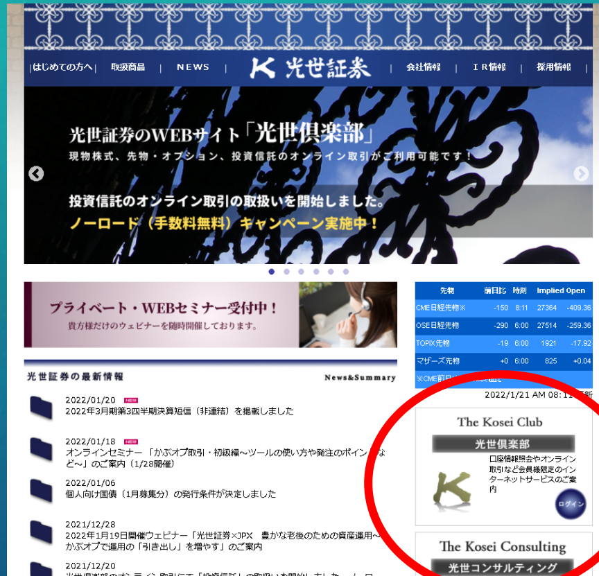
【光世証券ホームページ トップ画面】