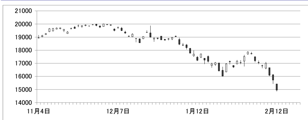
日経平均株価（2015年11月4日～）

セクター別では全てが大幅下落する結果となった。下落トップは証券・商品となった。株式市場の大幅下落で、今後、今後収益が悪化することが見込まれるため、下落幅が大きくなった。3位にはその他金融が入った。日銀のマイナス金利導入の発表により、大きく買われたセクターの1つだったが、市場全体の下落に抗し切れなかった。前週下落率トップだった銀行は下落5位となり、依然弱い展開だった。